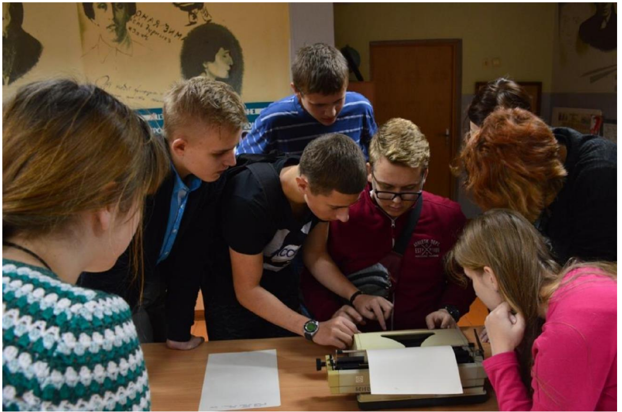
Квест "Скарбы ліцэя"