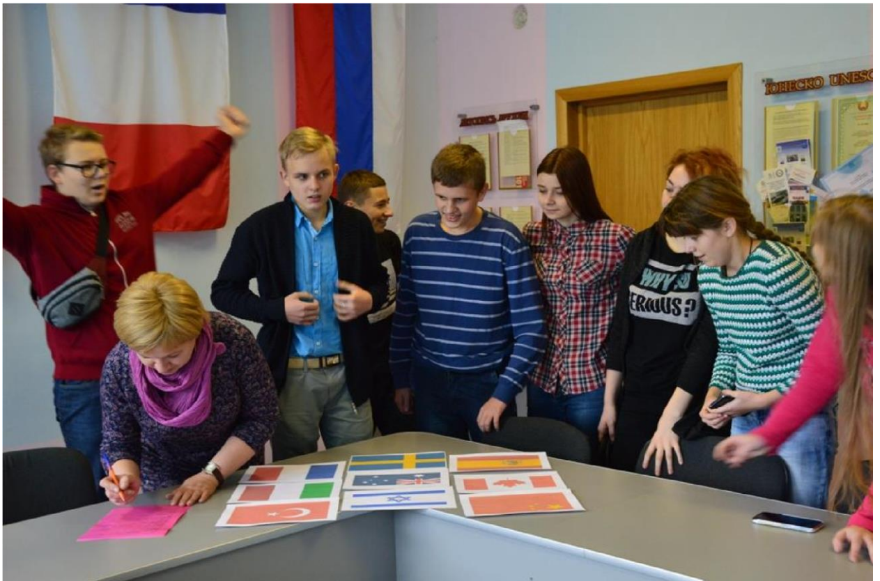
Лицеисты в тюрме... Спокойствие, только спокойствие!