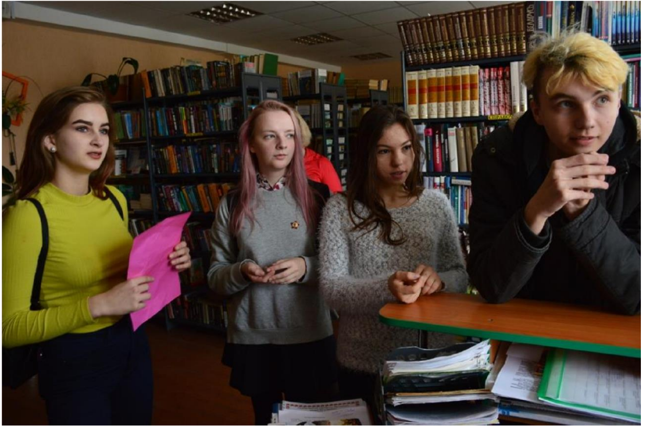
Квест "Скарбы ліцэя"